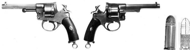
Fig. nr. 2 – Revolverul Buescu Model 1876 de cal.11 mm. Armă obținută prin hibridizarea și îmbunătățirea mai multor modele străine, consacrate. Cartușul avea cca 1,5 grame pulbere de azvârlire și un proiectil de masă relativ mare, cca 15 grame.

Către finele secolului XIX s-a pus problema modernizării armamentelor, iar interesul României s-a îndreptat către producătorii francezi, de altfel printre cei mai mari din Europa în acea epocă.