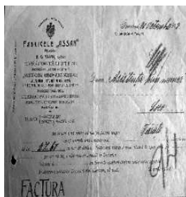
Fig. nr. 13 – Factura emisă de Fabricile Assan

prin intermediul unei facturi precum cea emisă la 28 Septembrie 1913 de „Școala de Apicultură către Onor. Biroul Asistenței Publice, Loco”, prin ea fiind livrați „Cinci stupi sistem Hand cu albine și cu diferite accesorii, a 50 lei unul, deci, lei 250” [23]. La 20 Septembrie 1913, Fabricile „Assan” vindeau către „Asistența prin muncă” „Făină” în valoare de 80,90 lei, o lună mai târziu, la 20 octombrie, vânzând „Tărâțe” în valoare de 27, 60 lei [24] (Fig. 13).