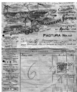
Fig. nr. 2 – Factură emisă de Maximillian Tonnolla

În data de 11/24 Aprilie 1913, „Societatea Anonimă Română pentru conducte de apă, Fost Sucursala a Companiei Generale de conducte de apă din Liège (Belgia)”, adresa „Dlui Doctor Minovici pentru Biroul Asistenței București”, o factură prin care se stipula: „Avem onoare a vă înainta factura noastră în valoare de lei 170,10 relativă predărei mărfii următoare conform comandai Dvs. Primiți, vă rugăm, salutările noastre deosebite” [9]. Tot în luna aprilie a anului 1913, pe adresa „D-lui dr Minovici pentru Biroul Asistenței”, celebra „Fabrică sistematică de Cărmizi, Cariere de Nisip și Pietriș Maximillian Tonolla” emitea factura no. 162 „ pentru următoarele materiale furnizate pe comptul și riscul său ” – „Nisip roșu, 3 mc” (30 de lei totalul). Cu sediul în „Șoseaua Ștefan cel Mare, Adr. Teleg.: Fabrica Tonolla București, Telefon 18/95”, aceasta era des premiată pentru produsele sale [10], primind argintul la Cooperativa Română (1883), respectiv aurul (1894), Medalia de Aur la Expoziția Generală Română (1906) etc. (Fig. nr. 2).