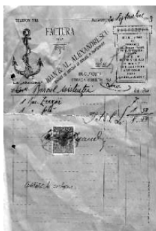
Fig. nr. 7 – Factura emisă de Ioan & Al. Alexandrescu

Un alt comerciant cunoscut al perioadei, Ioan & Al. Alexandrescu (Magasin „La Ancora”, București, Strada Bărăției, No. 33, Telefon 7/55 [17]), livra, în 20 Septembrie 1913 Onor. Biroul Asistenței, Loco , „1 Buc. Zoagăr – 7 lei, 1 Buc. Pilă – 1,50 lei” (Fig. nr. 7).