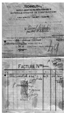
Fig. nr. 8 – Factură emisă de S.a.R Technolit