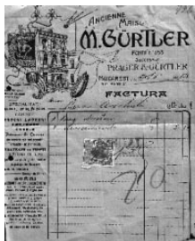
Fig. nr. 5 – Factură emisă de M. Gürtler

Tot Soc. E. Demetrescu Mirea trimitea spre achitare, în 28 Maiu 1913, Onor. Biroul Asistenței, o factură fiscală în valoare de 17 lei, reprezentând contravaloarea a „30 metri Lanț ptr vite + Cârlige de 2 lei” (Fig. nr. 6).