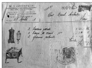
Fig. nr. 3 – Factură emisă de M. I. Ornstein

M.I. Ornstein, „atelier special de tichinigerie și de fasonat orice obiect de metal la strung”, cu „Centrala pe Strada Paris no. 27, fostă Doamnei (colt cu str. Colței), Atelierul Strada Aurora, 48 și Splaiul Alexandri, 20” vindea Onor. Biroul Asistenței, Loco, cf. facturii din 27 Aprilie 1913 „2 lanterne pătrate, 2 lămpi de alamă, 2 geamuri rotunde” (Fig. nr. 3).