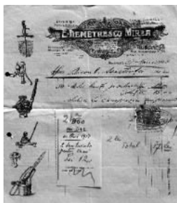
Fig. nr. 6 – Factura emisă de E. Demetrescu Mirea

Tot Soc. E. Demetrescu Mirea trimitea spre achitare, în 28 Maiu 1913, Onor. Biroul Asistenței, o factură fiscală în valoare de 17 lei, reprezentând contravaloarea a „30 metri Lanț ptr vite + Cârlige de 2 lei” (Fig. nr. 6).