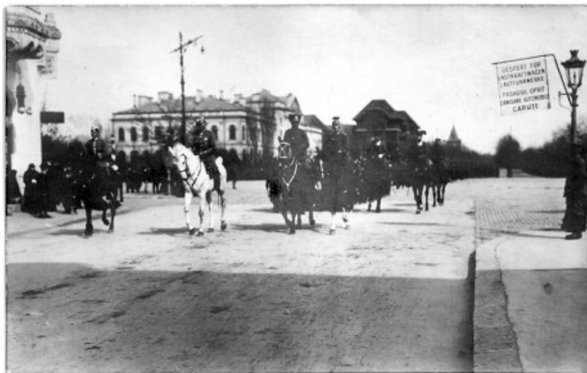
Fig. nr. 1 – Feldmareșalul Mackensen însoțit de suită, plecând de la Muzeul Antipa.

„Misiunea pentru care fusese lăsat în teritoriul ocupat l-a obligat să aibă dese întrevederi cu feldmareșalul Mackensen, comandantul trupelor de ocupație. Acesta i-a lăsat ca amintire o fotografie (astăzi într-un înaintat stadiu de degradare) (Fig. nr. 1) care îl arată călare în fața „Muzeului de la Șosea”, însoțit de doi aghiotanți și urmat de o escortă tot călare. Fotografia executată în 5.03.1918, îi este trimisă la 21.?.1919, având pe verso cuvintele: „Cea mai bună mulțumire pentru exemplarul lucrării asupra Muzeului de Istorie Naturală, oferit mie cu cea mai mare prietenie și pentru mine în cel mai înalt grad valoroasă (ss) Mackensen (?)” [2].