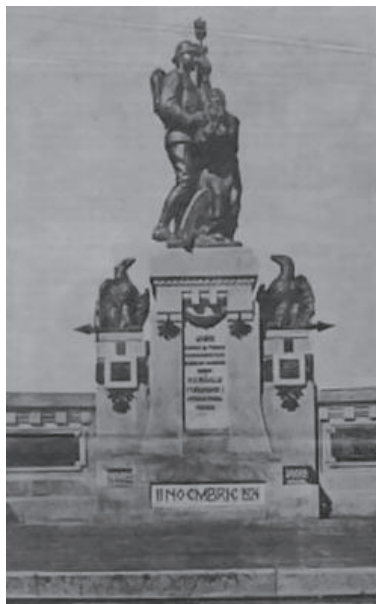
Fig. nr. 7 – Monumentul Unirii de la Cernăuți

împotriva Puterilor Centrale, pentru a îndeplini misiunea dată de regele Ferdinand într-un emoționant ordin de zi: „Ora mult așteptată de toată suflarea românească și îndeosebi de voi, vitejii mei ostași, a sunat. Regele vostru vă cheamă din nou la luptă ca să înfăptuiți visul nostru de veacuri, unirea tuturor romanilor.” 37 În octombrie-noiembrie 1918, în Bucovina, românii trec hotărâți la fapte. Astfel grupul parlamentar român de la Viena, se transforma în Consiliul Național Roman din Austria (președinte C. Isopescu – Grecul). De asemenea, în primul număr al ziarului „Glasul Bucovinei” s-a publicat programul de luptă intitulat „Ce vrem” din care reieșea cu claritate și ardoare unirea cu frații lor de la est și sud de Carpați. La 14/27 oct. 1918, la Chișinău, se constituie o Adunare Constituantă care se pronunța pentru realizarea în viitor a unirii și un Consiliul național cu rol executiv, alcătuit din 50 de membri. 38 Demersul politic al românilor