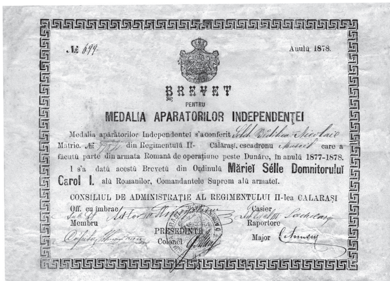
Fig. nr. 1 – Brevet pentru Medalia Apărătorilor Independenței, 1878