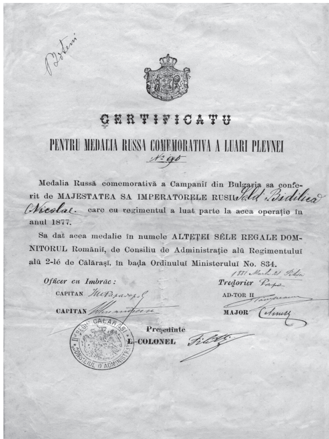
Fig. nr. 3 – Certificatu pentru Medalia Russă comemorativă a luări Plevnei „Medalia jubiliară Carol I er ”, în numele Alteței Sele Regale Domnitorul Romanii și din Ordinulu Măriei Selle Domnitorulu Carol I.