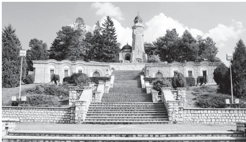
Fig. nr. 4 – Mausoleul de la Mateiaș

regimentele 30 și 70 pe Mateiaș și Pravăț, coloana de muniții a regimentului 30 în Lucieni și o semi-coloană mixtă în Ungureni-Boteniului și liziera lor cu satul Boteni 34 ; trenurile regimentare ale brigăzii 23 infanterie, iar ale regimentului 22 artilerie la Boteni-Balabani și ale brigăzii 24 infanterie la Văleni; regimentul 64 la est de Valea Argeșelului; regimentul 62 pe Valea Bughea și Albești și apoi între Valea Gârtii și Leaota. Cele mai crâncene lupte s-au dat în zona Dragoslavele-Mateiaș, apoi Lerești-Voinești-Nămăiești. În final, comandantul suprem al armatei germane Von Morgen a fost nevoit să recunoască eroismul soldaților români, iar regale Ferdinand a conferit regimentului 70, ordinul militar „Mihai Viteazu”, pentru că a ținut linia frontului. Mulțime de morți a înghițit pământul atunci. În cintea lor, s-a ridicat Mausoleul de la Mateiaș. Alți fii ai Botenilor au luptat pe alte linii de front Mărășești, Mărăști, precum și în Dobrogea de Sud (astăzi aparținând Bulgariei) – unde și-a dat viața eroul nostru Nicolae Leau.