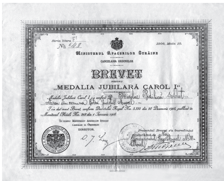
Fig. nr. 2 – Brevet pentru Medalia jubiliară Carol I, 10 mai 1906