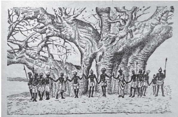
Fig. nr. 2 – Baobab ( Adansonia digitata din Africa centrală (după Constantin – Faideau: Les plantes) [3])

cu capul în jos”, numit și „copacul-butoi”. Crește solitar în savanele uscate. Are o durată de viață lungă, probabil de până la 1.500 de ani.