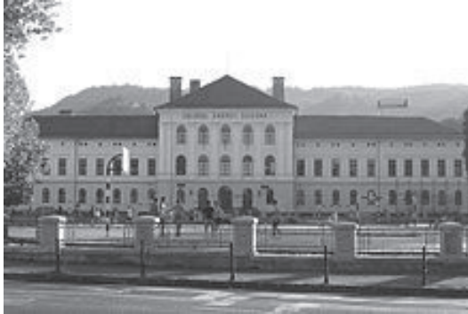
Fig. nr. 3 – Colegiul Național „Andrei Șaguna” din Brașov

Cuvântul academicianului Emil Pop, susținut cu ocazia întrunirii promoției 1915 a Liceului „Andrei Șaguna” din Brașov (Fig. nr. 3), atât de erudit și emoționant [18], merită republicat integral , spre luare la cunoștință a meritelor semnificative ale înaintașilor în domeniul educației și învățământului românesc, de către generațiile următoare.