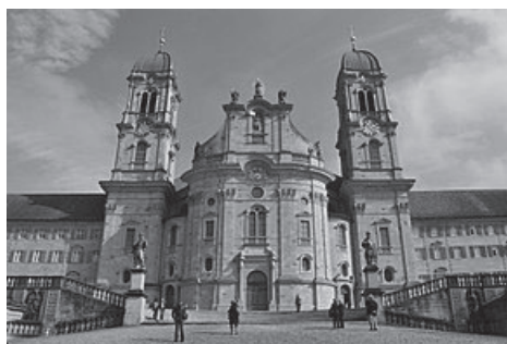
Fig. nr. 4 – Abația Einsiedeln

Madona Neagră din Einsiedeln din Capela harului constituie un punct de atracție pentru pelerini și turiști. Comunitatea numără circa 60 de membri. Mănăstirea nu este parte a unei dioceze, ci are statutul unei abații teritoriale. De la întemeierea din 1130, mănăstirea benedictină Fahr de la Zürich aparține abației Einsiedeln. Ca urmare abatele din Einsiedeln este totodată și cel al mănăstirii Fahr. Ele constituie împreună singura mănăstire dublă a Ordinului Benedictinilor din lume.