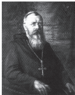
Fig. nr. 2 – Arhiepiscopul romano-catolic Raymund Netzhammer

Raymund Netzhammer (Fig. nr. 2) provine din comuna urbană și localitatea de frontieră germano-elvețiană Waldshut-Tiengen, aparținând actualmente comunei Klettgau din landul Baden-Württemberg (Germania), născut Albin Netzhammer 2 . În 1881 s-a alăturat abăției benedictine din Einsiedeln unde a obținut numele religios Raymund. La Chur, în 5 septembrie 1886, a fost consacrat preot.