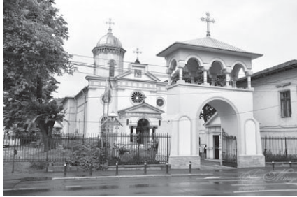
Fig. nr. 5 – Catedrala Sf. Vasile cel Mare din București

Astfel, după cum este cunoscut, în 1909 Raymund Netzhammer a pus piatra de temelie a catedralei Sf. Vasile cel Mare din București, situată în strada Polonă nr. 50, prima biserică română unită cu Roma (greco-catolică) 7 , de rit bizantin român, din Regatul România (Fig. nr. 5).