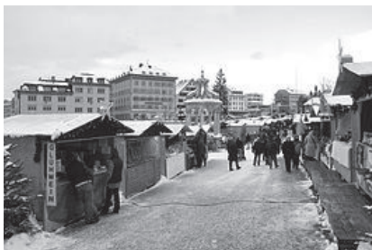
Fig. nr. 3 – Localitatea Einsiedeln, cantonul Schwytz, Elveția

Mănăstirea Einsiedeln (Abbatia territorialis Sanctissimae Virginis Mariae Einsiedelnensis) cu biserica abației (Fig. nr. 4) și catedrala Adormirea Mariei și Sf. Meinrad din Einsiedeln este o biserică benedictină dispensată în comuna Einsiedeln din cantonul Schwytz. Abația reprezintă o secțiune însemnată pe Calea lui Iacob 3 și ținta a numeroși pelerini.