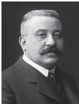
Fig. nr. 1 – Savantul Grigore Antipa

Pescăriilor Statului. Președinte al Comitetului de direcție al Administrației P.A.R.I.D. Consilier expert al Comisiei Europene a Dunării. Delegat Național, Vicepreședinte și raportor pentru întreaga Mediterană de Est: Marea Neagră, Marea Marmara și Marea Egee al Comisiei Internaționale pentru Explorarea Științifică a Mării Mediterane (CIESM) [5, 6, 7]. Membru al Institutului Oceanografic din Paris.