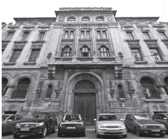
Fig. nr. 2 – Fosta bancă Marmorosch-Blank.

Edificiul proiectat de Petre Antonescu va adăposti după 1945, Banca de Investiții, iar după 1990, BRD. Clădirea este realizată în stil neoromânesc, iar interiorul băncii este realizat în forme Art Nouveau și Art Déco. Impresionează holul mare destinat ghișeelor, care se înalță pe două niveluri, în jurul său aflându-se birouri. Mauriciu Blank a dorit o lucrare în stil național, după cum afirmă Petre Antonescu. Pictura interioară decorativă este realizată de Cecilia Cuțescu-Storck. Arhitectul a folosit materiale prețioase: granit de Suedia, marmură, blocuri de piatră de Rusciuk, fier forjat, bronz masiv etc. Din nefericire, în ciuda valorii incontestabile a lucrării, clădirea este, în prezent, părăsită.