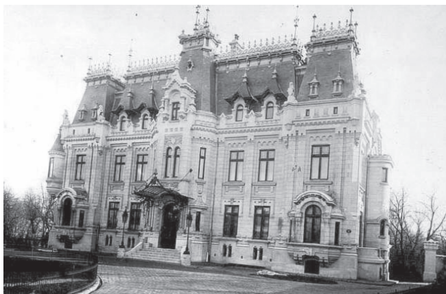
Fig. nr. 3 – Palatul Kretzulescu. Cabinetul de Stampe al Academiei Române

atât specifice neorenașterii franceze, cât și elemente din repertoriul heraldic european (scuturi, dragoni, vulturi, grifoni etc.).