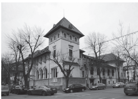
Fig. nr. 6 – Institutul Cultural Român

Vila Malaxa , aleea Alexandru nr. 38, intersecție cu str. Ermil Pangratti Proiectată de arh. Petre Antonescu și executată în anul 1930, clădirea are la exterior elementele definitorii ale stilului neoromânesc: împărțirea fațadei în partiții verticale, asimetria, un turn foisor, streșini late, acoperiș înalt cu pante abrupte, loggii, arce în plin cintru. Toate încăperile principale ale casei industriașului Nicolae Malaxa se grupează în jurul sălii mari de conferințe. Astăzi, aici își are sediul Institutul Cultural Român.