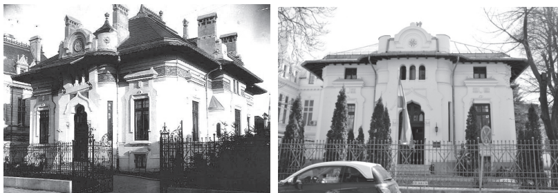
Fig. nr. 4 – Casa din str. Gina Patrichi nr. 8. Imagine de arhivă și fotografie din 2015

Clădirea a reprezentat „o primă încercare de arhitectură românească” [3, p. 55] a lui Petre Antonescu pentru o locuință orășenească. Friza de sub steașină este executată în frescă. „Dispoziția planului este concepută pe aceeași idee a grupării simetrice a tuturor camerelor principale împrejurul unei piese centrale, de forma unui octogon regulat, având funcția de hol deschis direct spre încăperile de recepție și camerele de locuit”, idee ce se va relua la casa Oprea Soare.