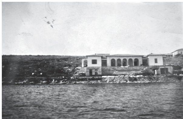
Fig. nr. 7 – Fotografie din 1939. Vedere dinspre mare a Institutului Academic Român din Saranda, Albania