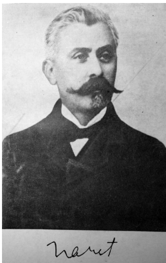
Fig. nr. 1 – Spiru Haret, un lucaefăr reformator al școlii românești

Keywords: education reform, academy, haretism, visionary, vanguardist.