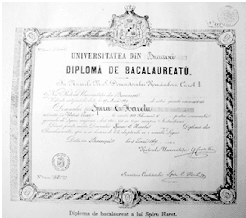
Fig. nr. 3 – Diploma de bacalaureat a lui Spiru Haret

Politica proaspătului stat românesc de încurajare a tineretului să studieze, îi permite să urmeze cursurile Facultății de Științe a Universității din București. Remarcat de către Titu Maiorescu este trimis în 1874 la Paris, iar în 1878 obține la Universitatea Sorbona titlul de doctor în științe matematice, cu teza „ Despre invariabilitatea marilor axe ale orbitelor planetare ”, ducând mai departe și corectând cercetarile lui Laplace, Louis de Lagrange și Denis Poisson asupra varietății axelor orbitelor planetare. Eruditul matematician și astronom Jules Henri Poincaré observa: „In 1878 Spiru Haret a dovedit existența termenilor seculari de gradul III și acest rezultat a provocat o mare uimire”. Teza de doctorat al lui Haret este publicată în „Tomul XVIII al Memoriilor Observatorului din Paris” și republicată în 1885 și 1889 în „Analele Observatorului Astronomic” din Paris. Facultatea