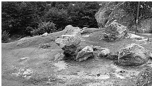
Fig. nr. 4 – Scaunul lui Negru Vodă de la Cetățuia, județul Dâmbovița, Muntenia

În comuna Cetățeni din județul Argeș, se află Mănăstirea Cetățuia. Este clădită pe vârful unei stânci și atribuită de tradiție secolelor XIII – XIV. Biserica Cetatea Schitului, atribuită voievodului Negru Vodă, s-a construit concomitent cu cetatea Câmpulungului Muscel – orașul a fost prima capitală a Țării Românești – în secolul al XIII-lea. Aici, pe malul stâng al apei, pe lângă stânca pe care se află „Amazoana” se află și „Scaunul lui Negru Vodă” (Fig. nr. 4) sculptat în piatră. Pe el apar semne simbolice deosebite (tridentul și svastica), iar mărimea sa ne face să ne gândim la uriașii de altă dată.