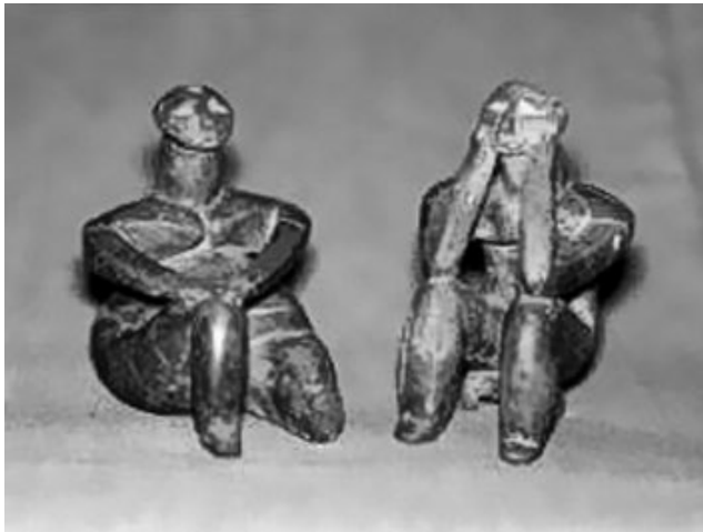
Fig. nr. 5 – „Gânditorul și Femeia sa” – statuete Hamangia din neoliticul românesc de acum 7.000–8.000 de ani

de aici, prin intermediul culturilor ce ajung până la Istanbul pentru unele, până la Budapesta, Belgrad și dincolo de Kiev sau Lvov pentru altele.