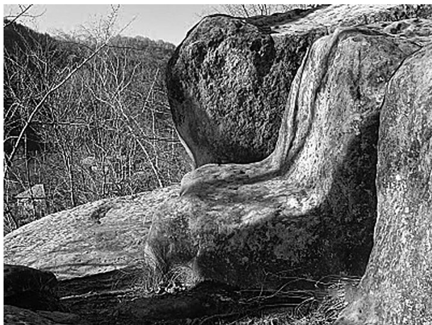
Fig. nr. 3 – Scaunul lui Dumnezeu de la Aluniș, județul Buzău, Muntenia

În comuna Cetățeni din județul Argeș, se află Mănăstirea Cetățuia. Este clădită pe vârful unei stânci și atribuită de tradiție secolelor XIII – XIV. Biserica Cetatea Schitului, atribuită voievodului Negru Vodă, s-a construit concomitent cu cetatea Câmpulungului Muscel – orașul a fost prima capitală a Țării Românești – în secolul al XIII-lea. Aici, pe malul stâng al apei, pe lângă stânca pe care se află „Amazoana” se află și „Scaunul lui Negru Vodă” (Fig. nr. 4) sculptat în piatră. Pe el apar semne simbolice deosebite (tridentul și svastica), iar mărimea sa ne face să ne gândim la uriașii de altă dată.