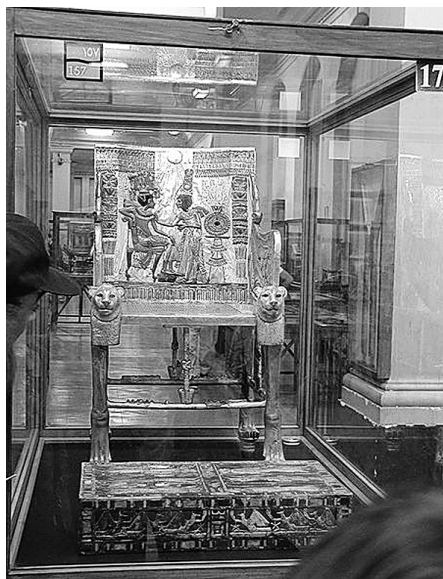
Fig. nr. 1 – Tronul faraonului Tutankamon (1341–1324 a. Chr.)

lemn de cedru , vopsit și cu diferite încrustații din pietre semiprețioase, sief și ceramică. Multe s-au păstrat până în ziua de azi, în tezaurele regale descoperite în mormintele faraonilor: scaune cu spătar , taburete simple sau pliante , tronuri impunătoare (Tronul lui Tutankamon (1341–1324 a. Chr.; Fig. nr. 1), canapele, paturi sau divane ce imitau prin forma lor silueta unor animale, lăzi sau lavițe. Este important de menționat faptul că mobila egipteană a influențat mult dezvoltarea mobilei din arealul civilizației grecești și romane și a constituit principala sursă de inspirație ale „ stilului Empire ” din Europa, de la începutul secolului al XIX-lea.