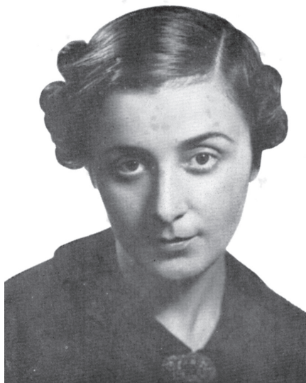
Fig. nr. 1 – Poeta Ecaterina Săndulescu (1904–1988)

În anul 1934 (la 30 de ani) își urmează soțul la București, și face naveta la Ploiești.