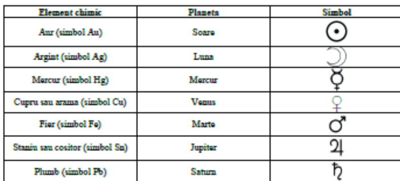
Fig. nr. 5 – Tabel elemente chimice – planete (reproducere după lucrarea lui Ivan Evseev, Enciclopedia semnelor și simbolurilor culturale , Editura Amarcord, Timișoara, 1999, pp. 20–21)

În continuare prezint elementele chimice folosite de primii cercetători alchimiști, care în opinia lor aveau corespondență cu unele planete din sistemul solar , astfel: