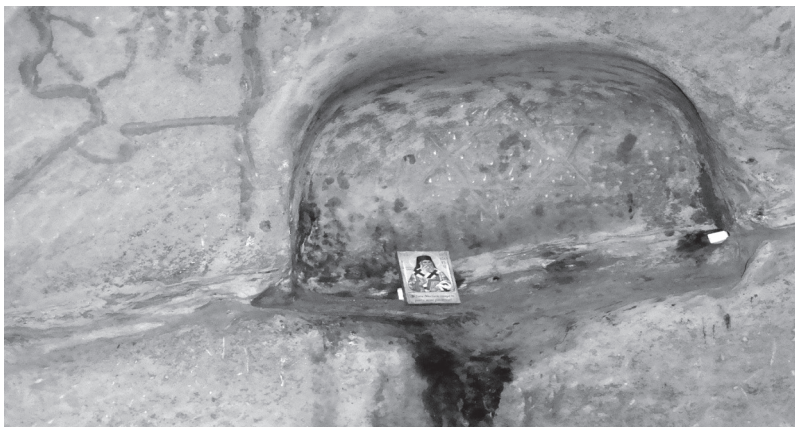
Fig. nr. 2 – „Altar”, care are încrustat simbolul „Scutul lui David” sau „Steaua lui David”, iar în mijlocul acestuia se găsește simbolul yin-yang (Sursa: „Grotă” sau „Mănăstirea rupestră” de lângă localitatea Șinca Veche, județul Brașov (teren, fotografie executată în luna august 2012))

Referitor la simbol menționăm că, în anul 2012 pe când mă aflam în zona localității Șinca Veche, județul Brașov, mai precis în „Mănăstirea rupestră”, am descoperit acest simbol încrustat pe unul din pereți. Interesantă este poziționarea lui în mijlocul altui simbol reprezentând „Scutul lui David” sau „Steaua lui David” 19 . Incinta unde se află simbolul se numește „altar”. Vă prezint fotografia pe care am realizat-o în locația respectivă.