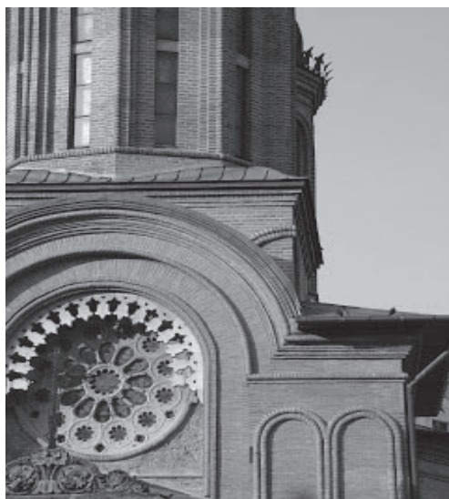
Fig. nr. 3 – Zodiacul de la Mănăstirea Antim a fost adăugat în anul 1863, prin grija episcopului Clement al Argeșului.

– este păstrătoarea unor simboluri alchimice (de exemplu la Mănăstirea Antim, din București, deasupra acoperișului pridvorului, zidul este străbătut de o rozetă în piatră cu vitralii reprezentând zodiacul), dar și a altor simboluri cu conotații ezoterice întrebuințate de diferite grupuri elitiste.