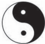
Fig. nr. 1 – Simbolul yin-yang

Simbolul tao -ist care reprezintă conceptul yin-yang este următorul: