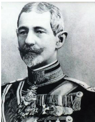
Fig. nr. 1 – Alexandru Averescu

Mama, Casuca, născută Desilla, de profesie moașă, era foarte atașată de băiat. Neînțelegerile dintre părinți l-au determinat pe micul Alexandru să-i ofere mamei sale, o femeie energică și inteligentă, multe din bucuriile copilăriei.