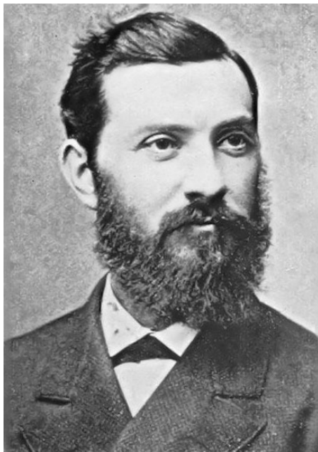
Fig. nr. 1 – Gregoriu Ștefănescu (1836–1911)

Începuturile Geologiei și Paleontologiei românești sunt legate strâns de numele unui mare om de știință, deschizător de drumuri: Gregoriu Ștefănescu (10 februarie 1836, Eliza Stoenеști, azi Pelinu, jud. Ialomița – 20 februarie 1911, București). Un savant complex, a cărui valoare a fost pe deplin recunoscută și peste hotare. Motiv pentru care acum, urmașii săi spirituali de la Universitatea București îl numesc cu recunoștință „ patriarhul științelor Pământului ” din țara noastră.